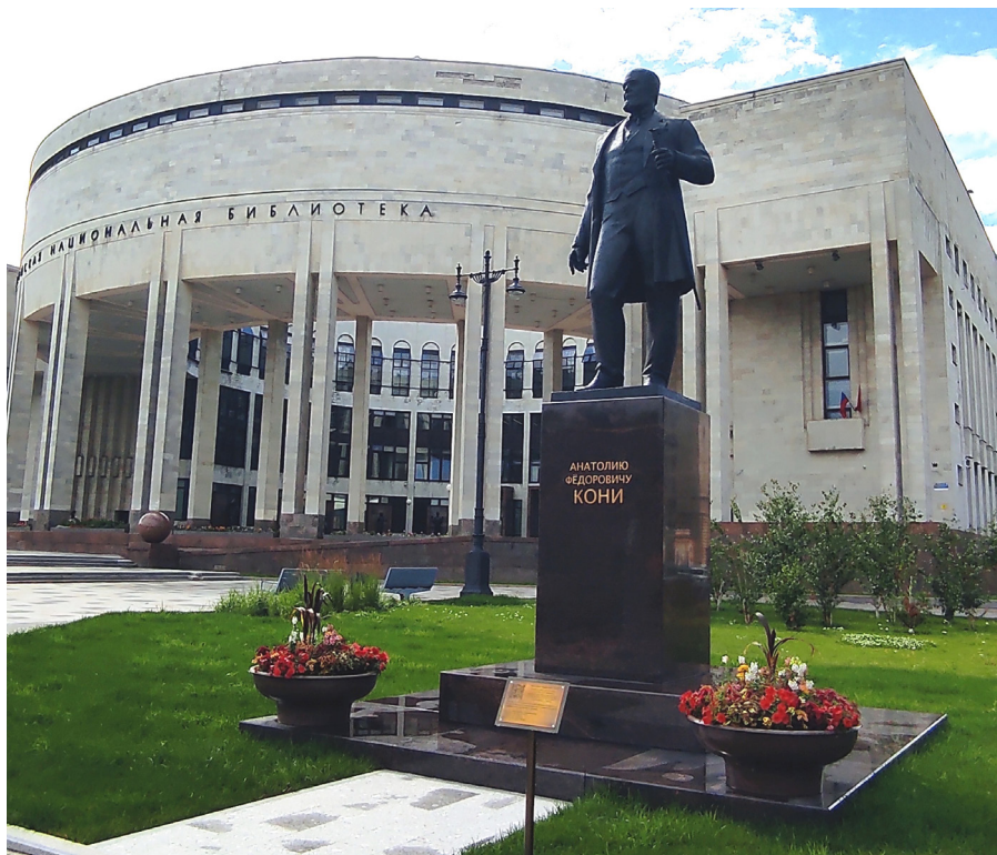
Илл. 3. Памятник А. Ф. Кони в Санкт-Петербурге.

Символично, что в год 180-летия со дня рождения А. Ф. Кони, выдающегося правоведа и талантливого писателя, ему установлен памятник возле одного из крупнейших мировых центров чтения — Российской национальной библиотеки в Санкт-Петербурге.