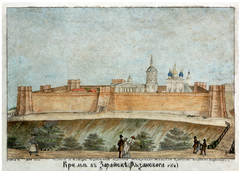
Илл. 2. Кремль в Зарайске (Бровкин М. С. Бумага, акварель. 1859 г. Государственный музей-заповедник «Зарайский кремль»)