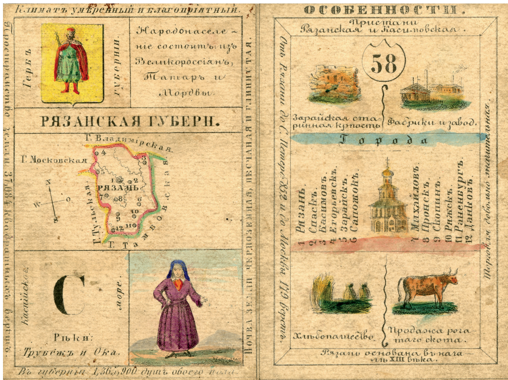
Илл. 4. Грибанов К. М. Карточка № 58 «Рязанская губерния» из набора географических карточек Российской империи (Бумага, офорт, гуашь. 1856 г.)