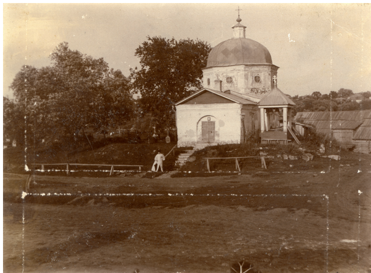
Илл. 5. Вид Входа-Иерусалимской церкви в городе Зарайске (Неизвестный фотограф. Желатиновый отпечаток. 1900-е гг.)