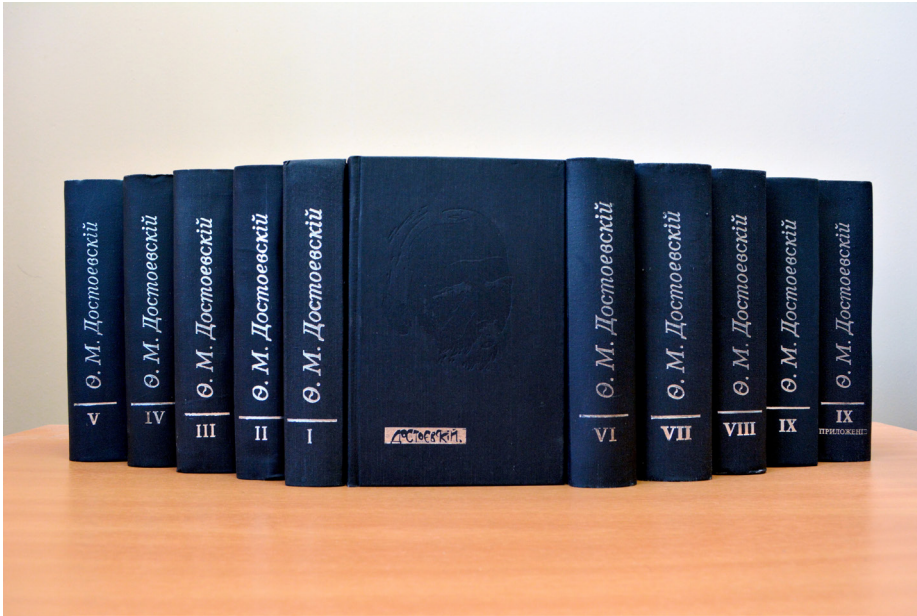
Илл. 2. Полное собрание сочинений Ф. М. Достоевского в авторской орфографии и пунктуации (вышедшие тома)