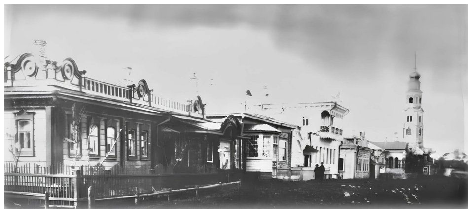
Илл. 1-2. Спас-Клепики. Рубеж XIX–XX вв. 1