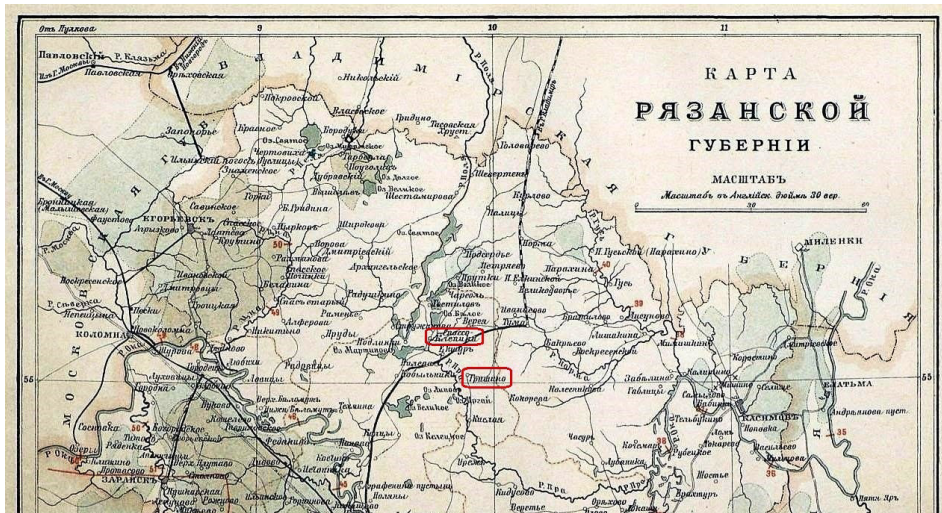
Илл. 4. Спас-Клепики и Гришино на карте Рязанской губернии 1899 г.

«Имущество это заключается въ имѣніи, находящемся въ Рязанской губерніи, Рязанскаго уѣзда, Спасъ-Клепиковской Волости, 4 20 стана, 5 20 Мироваго участка, въ деревняхъ Гришинѣ, Заболотьѣ, Чесмерной, Азаровой, Анниной и Заводской слободѣ съ принадлежащими къ нимъ большими лѣсными дачами, пустошами и разными угодьями» 7 .