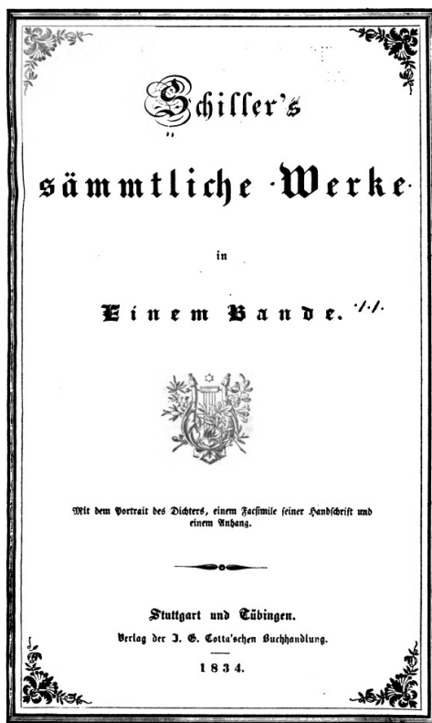
Илл. 2. Титульный лист собрания сочинений Шиллера 1834 г.