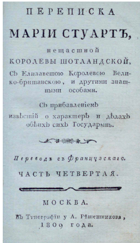
Илл. 3. Титульный лист издания 1809 г. «Переписка Маріи Стюартъ, нещасной Королевы Шотландской, съ Елизаветою, Королевою Велико-британскою, и другими знатными особами»

наблюдал Марию Стюарт в период ее воспитания при французском дворе, короткого «счастливого» замужества за королем Франциском II, а после смерти последнего сопровождал вдовствующую королеву на ее новое поприще в Шотландию. Брантом был покорен «божественной красотой» королевы, в которой «душа равнялась ея прелестям» 40 . «Всѣ удивлялись твердости Королевы Шотландской, — свидетельствует он о реакции католической Европы на гонения Марии со стороны победивших в ее стране протестантов, — и кажется ни кто съ такою неустрашимостию не сносилъ бѣдствій» 41 .