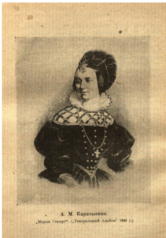
Илл. 1. Портрет А. М. Каратыгиной в роли Марии Стюарт 13

несчастной Королевы, и онъ, въ благоговеніи къ Промыслу, безмолвствуетъ предъ небесною карою, показывающею заблужденія этой женщины; онъ видитъ, что голова Маріи падаетъ какъ искупительная жертва — и ропоть негодованія замираетъ на устахъ его. Судъ неба строгъ, но правдивъ. Въ Маріи Стюартъ Шиллеръ остался поэтомъ Христіанскимъ и чисто современнымъ; онъ усладилъ послѣдній часъ злополучной Королевы чувствомъ религіознымъ, которое одно могло быть достойнымъ посредникомъ между этою бурною жизнію и ея ужасною кончиною; но въ возвышенности идеи и въ силѣ впечатлѣнія, поэтъ приблизился къ духу древней трагедіи, передавъ величавую, строгую красоту Греческой музы» 12 .