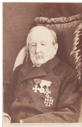
Fig. 1. M. I. Muravyov-Apostol. 1881

Поддерживать теплое общение писателю и декабристу помогали женщины: А. Г. Достоевская и воспитанница бездетного Муравьева-Апостола А. П. Сазанович. В архиве Достоевских сохранились единственное письмо Сазанович к Федору Михайловичу 11 и 22 письма за 1879–1888 гг. к Анне Григорьевне, часть из которых с обращением и от имени Муравьева-Апостола (« Матвѣй Ивановичъ и я ») 12 . Из них опубликованы лишь письмо к Достоевскому [Белов: 182] и три письма к жене писателя, написанных при его жизни (от 7 мая 1879 г., 16 июня 1879 г., 1 февраля 1881 г.) 13 , — при этом каждое из них напечатано с купюрами.